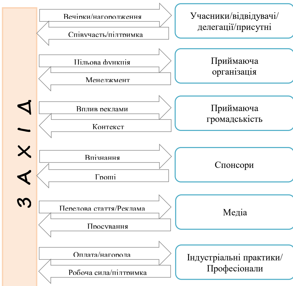
Схема 2. Схема взаємовідносин Scheme 2. Scheme of relationships

Event-індустрія має ряд зацікавлених сторін, включаючи громади, де