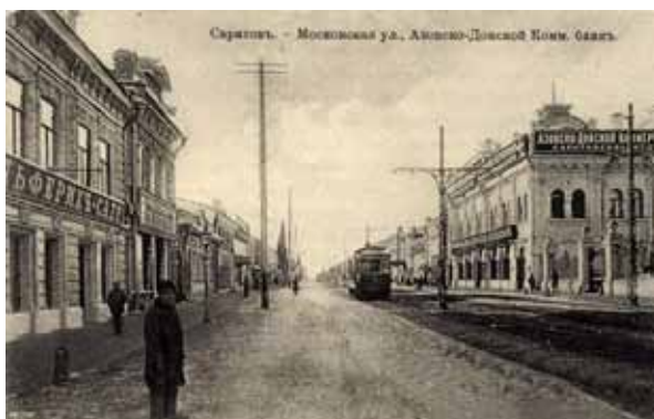
Іл. 1. Міський пейзаж. Листівка 1890 р. Саратов