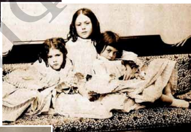
Іл. 4. Керролл Л. Груповий портрет дітей родини Лідделл. (За: [Електронний ресурс]. – Режим доступу : http://www.the-village.ru/village/weekend/events/111221-v-kieve-prohodit-vystavka-fotografiy-avtora-alisy-v-strane-chudes-lyuisa-kerrolla )