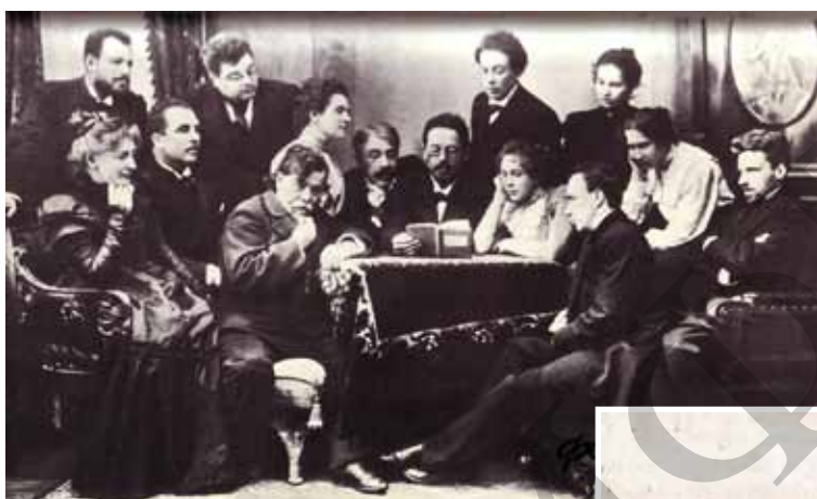
Іл. 3. Груповий портрет (А. Чехов читає акторам п'єсу «Чайка» Світлина 1898 р.