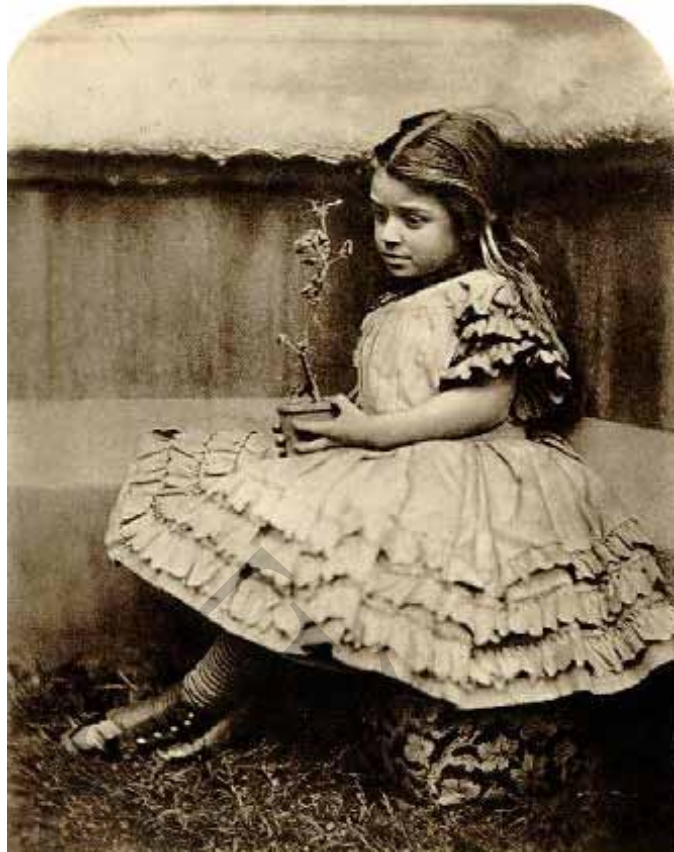
Іл. 6. Керолл Л. Художній портрет Марії Вайт. XIX ст. (За: [Електронний ресурс]. – Режим доступу : http://www.lewiscarroll.org/ carroll/photography/ )