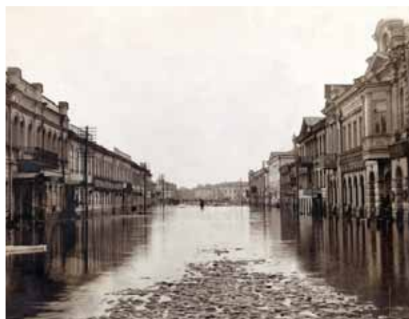
Іл. 2. Фотофіксація природних явищ у середмісті. Іваницький О. Колоризований міський пейзаж. Харків, вул. Рибна