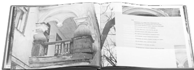
Іл. 11. Обкладинка і розворот книжки О. Ільченка «Деякі сні, або Київ, якого немає. Початок ХХІ ст. – Режим доступу : http://luluka.com.ua/books/deyak_sni_abo_ki_v_yakogo_nema-1382/ )