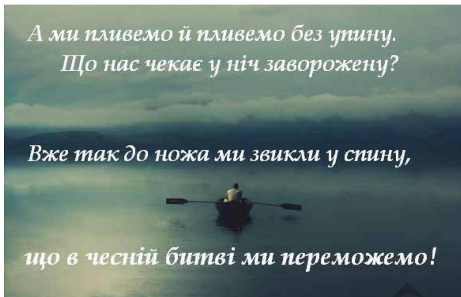
Іл. 9. Приклад аматорського поєднання площини фотозображення та уривка поетичного твору