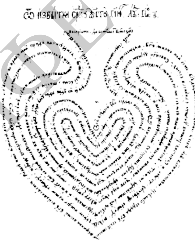
Іл. 10. Візуальна поезія. Вірш С. Полоцького «От избытка сердца уста глаголят». XVII ст. (За: [Електронний ресурс]. – Режим доступу : https://uk.wikipedia.org/wiki/%D0%A4%D1%96%D0%B3%D1%83%D1%80%D0%BD%D1%96_%D0%B2%D1%96%D1%80%D1%88%D1%96#/media/File:Symeon_polotsky.png )