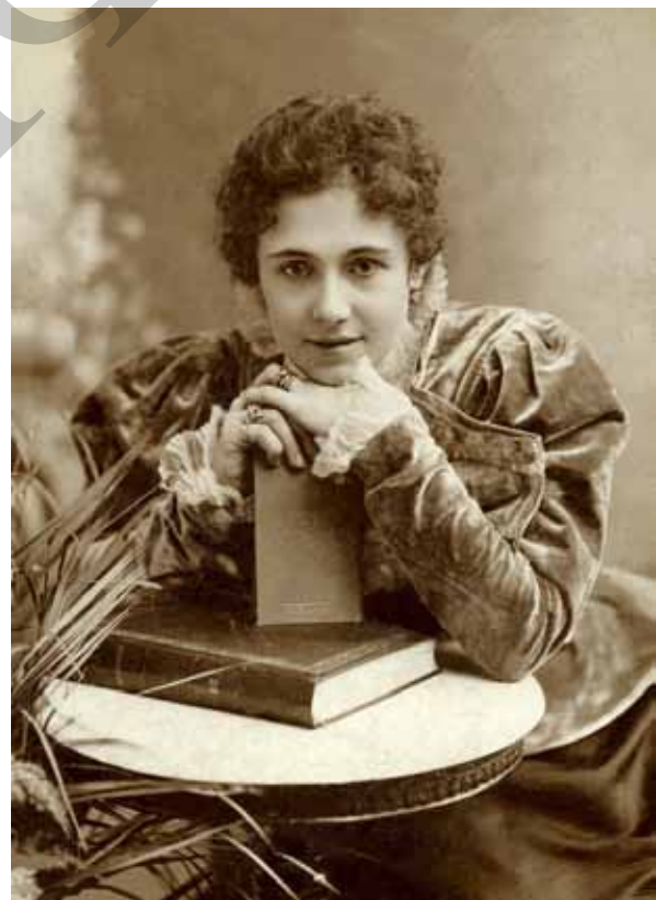
Іл. 8. Іваницький О. Портрет невідомої