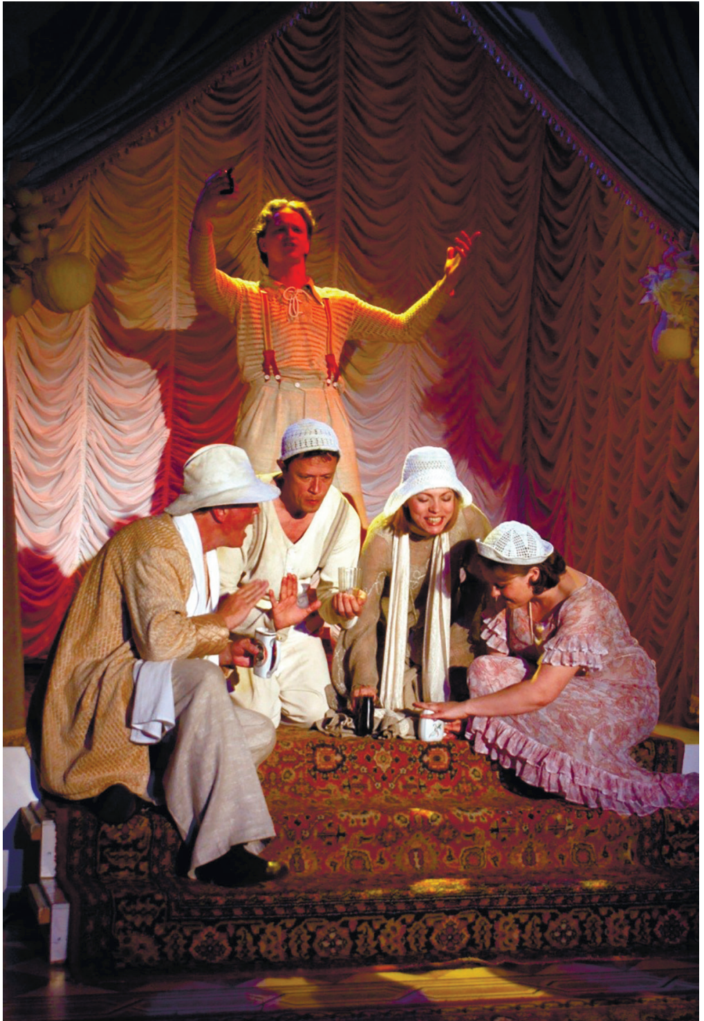
З вистави «Парнас дибки»