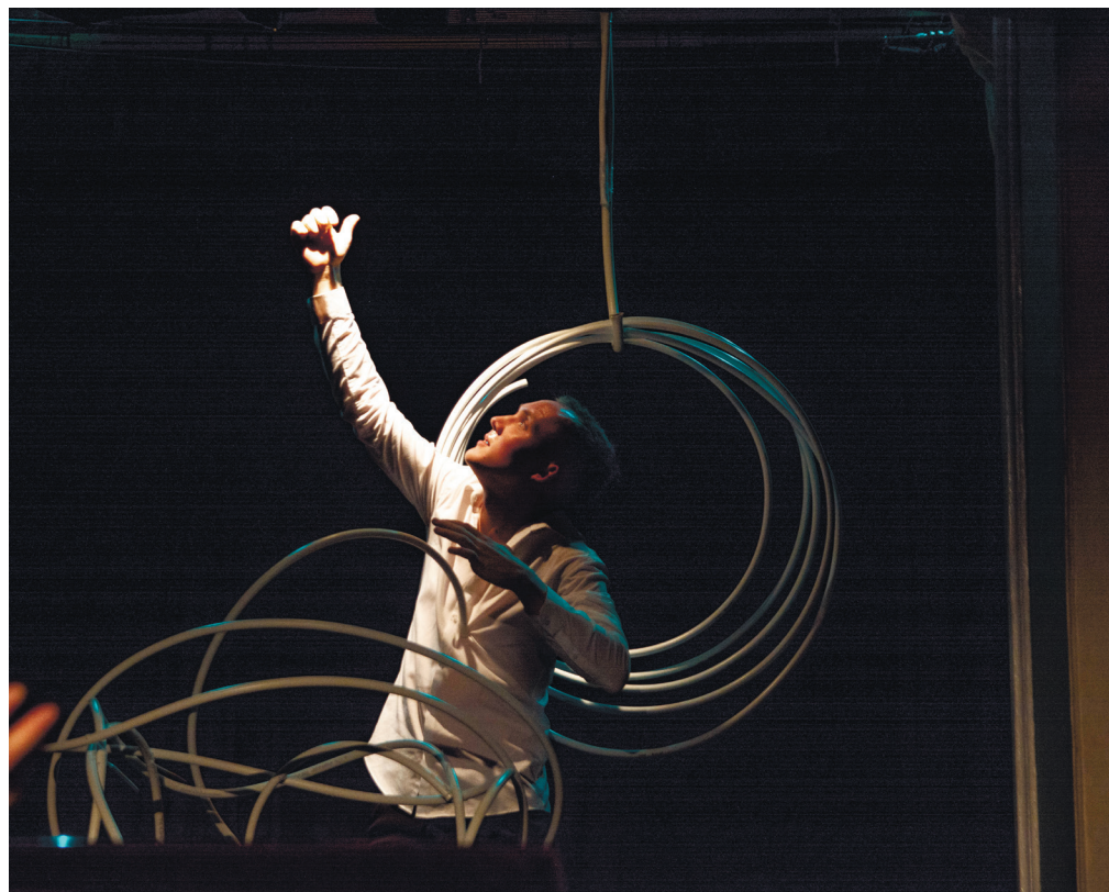
З вистави «Таємниця Шопена»