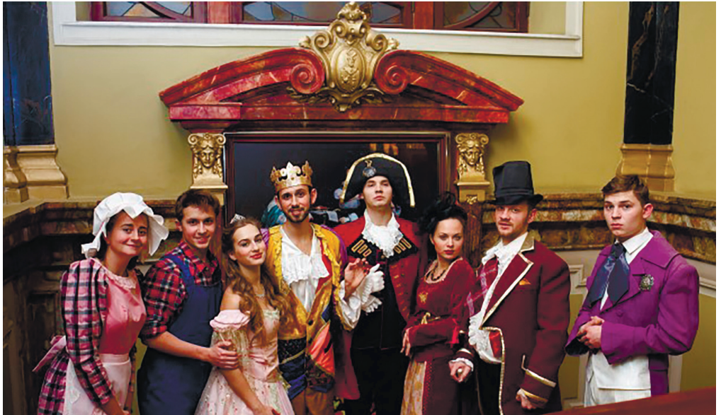
З вистави «Принцеса і сажотрус»