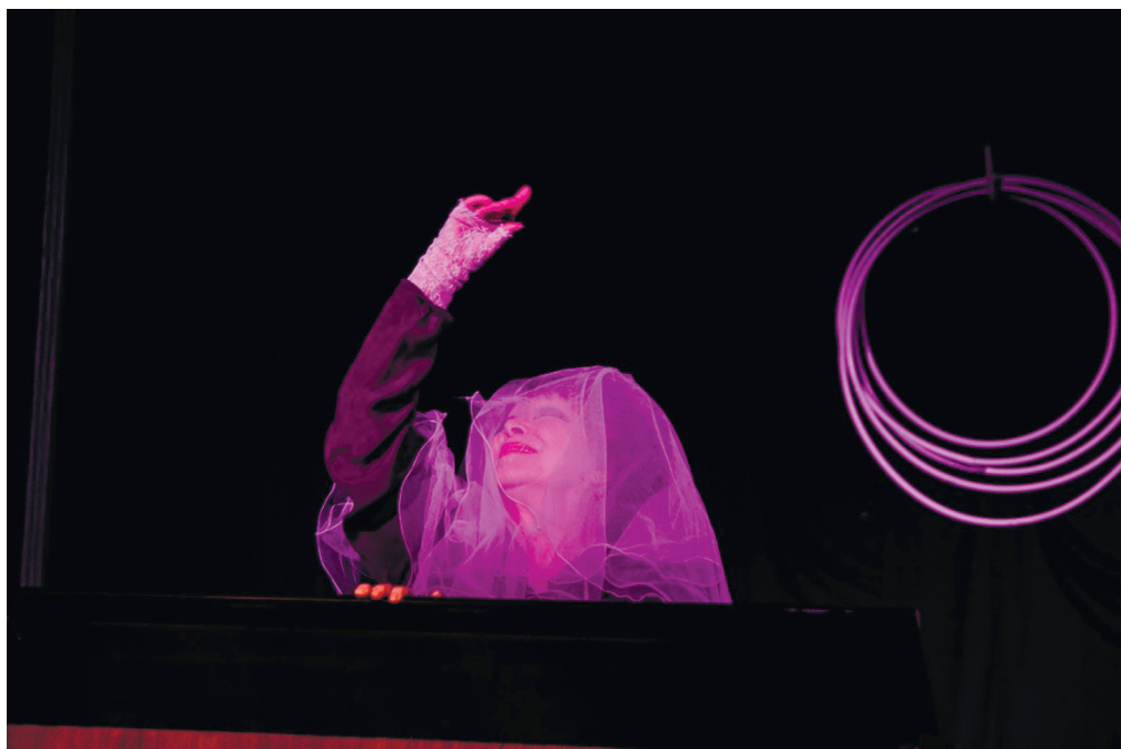
З вистави «Таємниця Шопена»