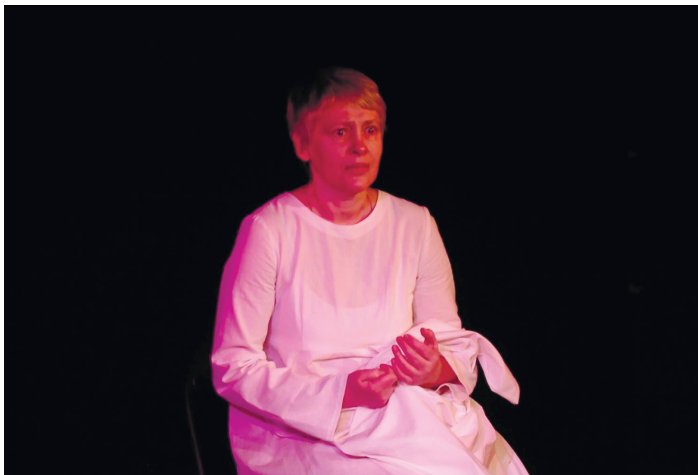
З вистави «Про Ромео і Джульєтту... тільки звали їх Маргарита та Абульфаз»