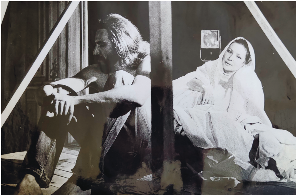
З вистави «Випромінювання батьківства»