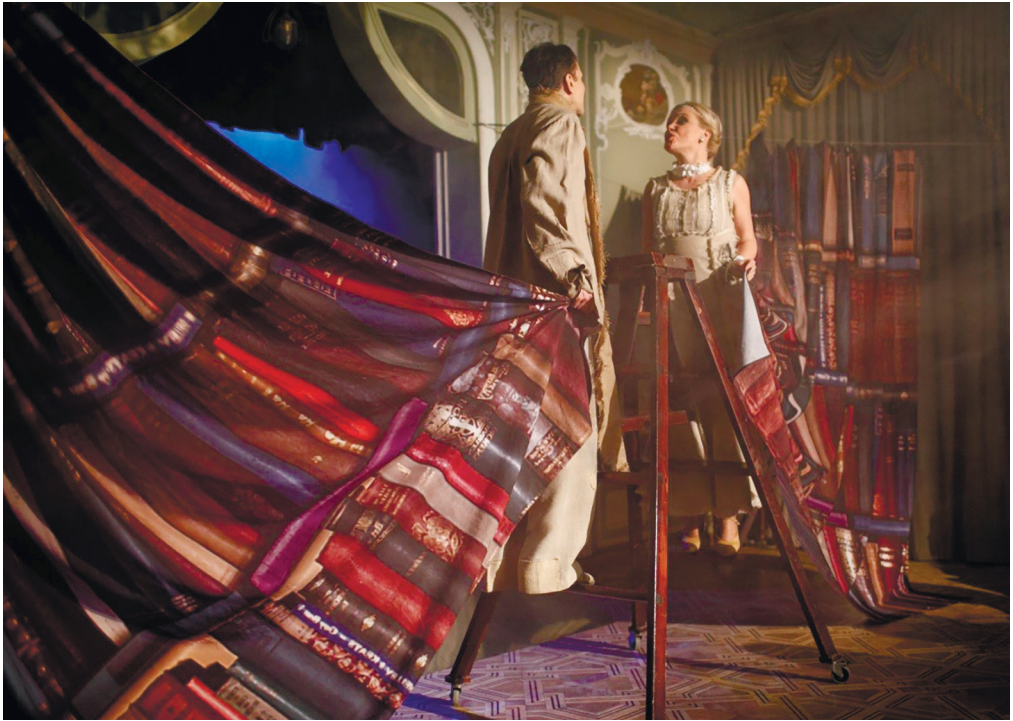
З вистави «Цветаєва плюс-мінус Пастернак»