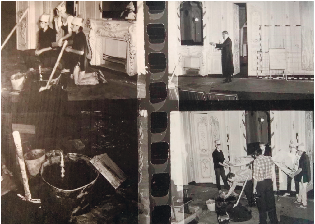
З вистави «Сад божественних пісень»