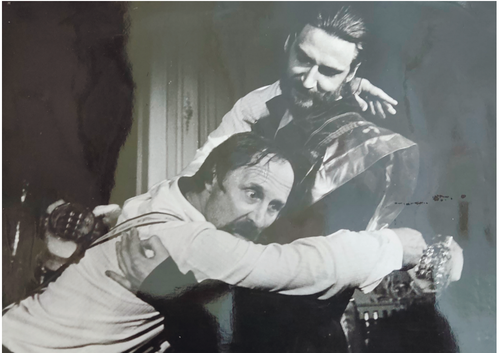
З вистави «Аудієнція»