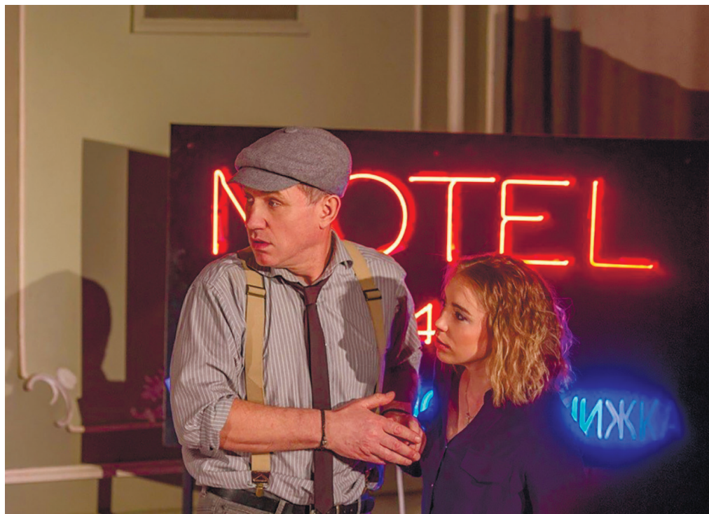
З вистави «Украдена краса»