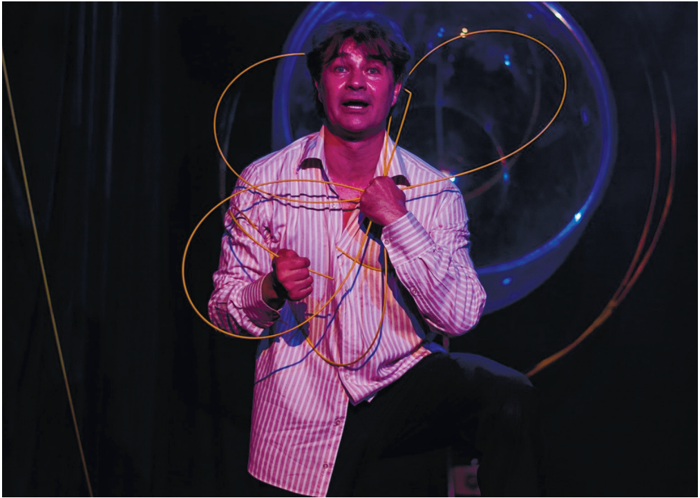
З вистави «Прекрасний звір у серці»