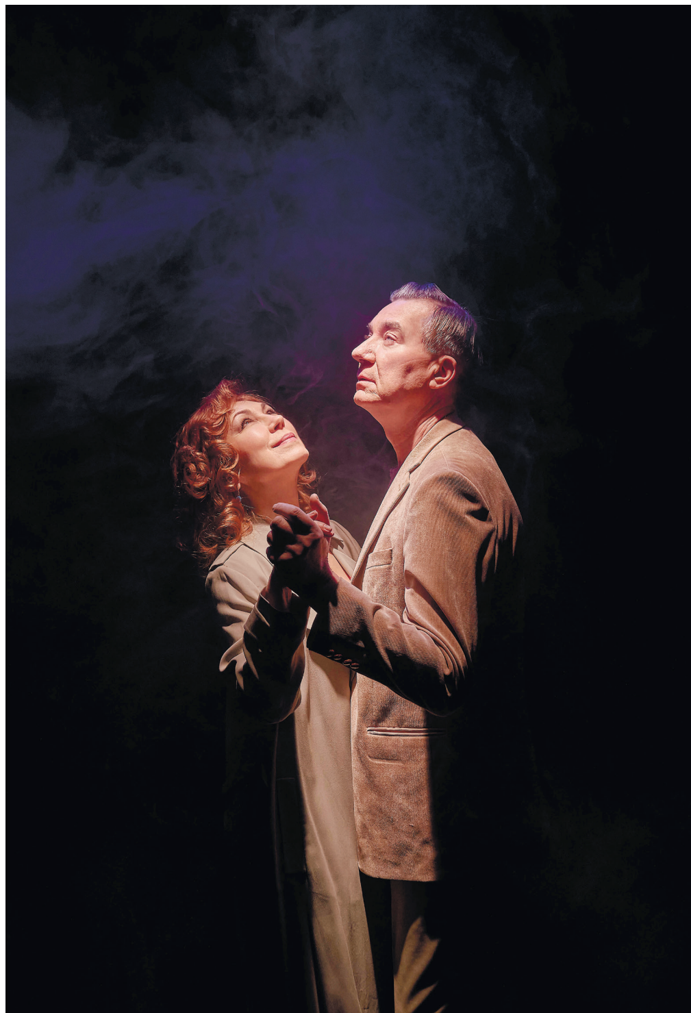
З вистави «Куди я з вами не піду»