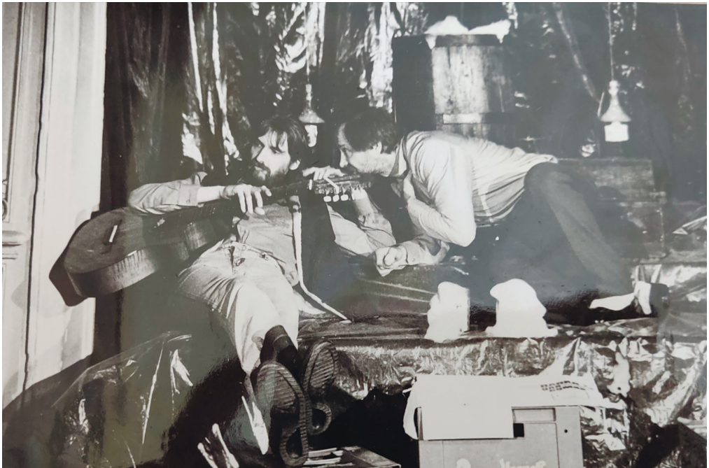
З вистави «Аудієнція»