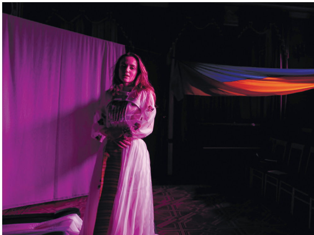
З вистави «Pro L. Мовою троянд»