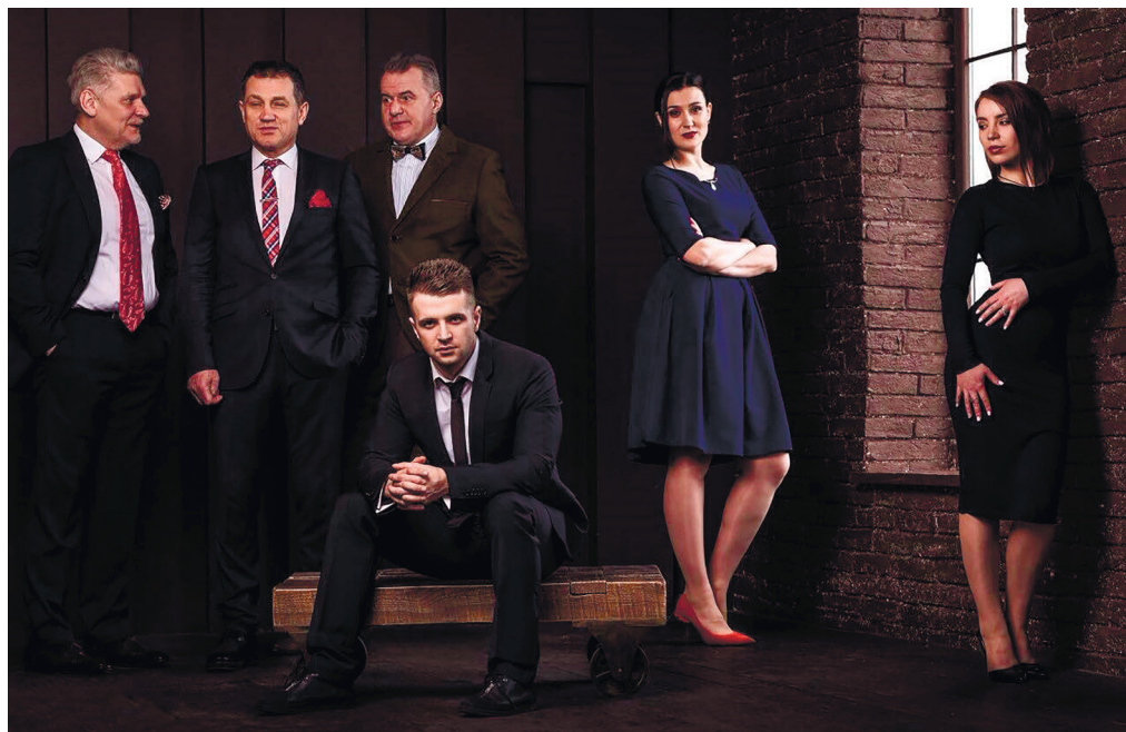
З вистави «Кафе "Республіка"»