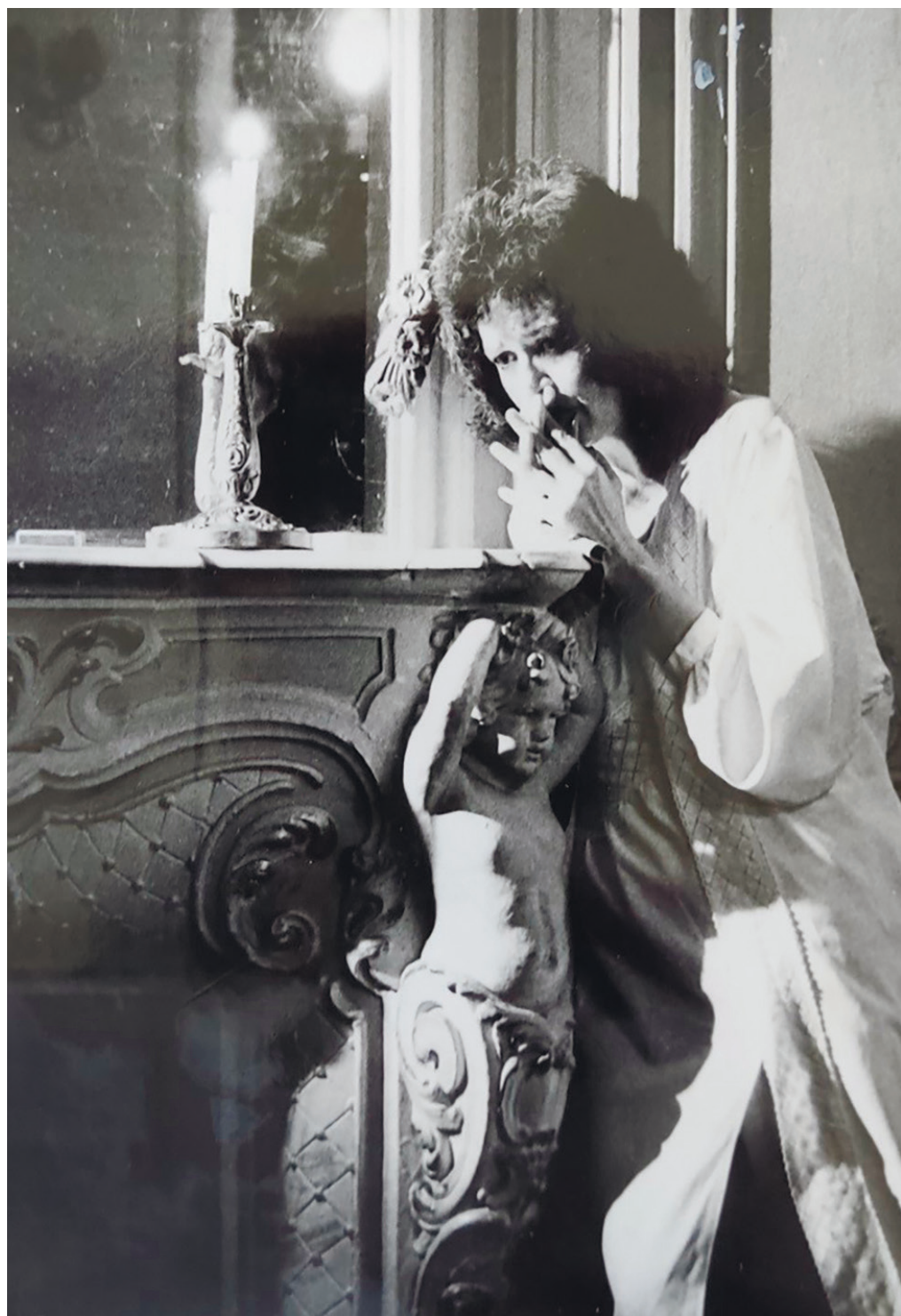
З вистави «Людський голос»