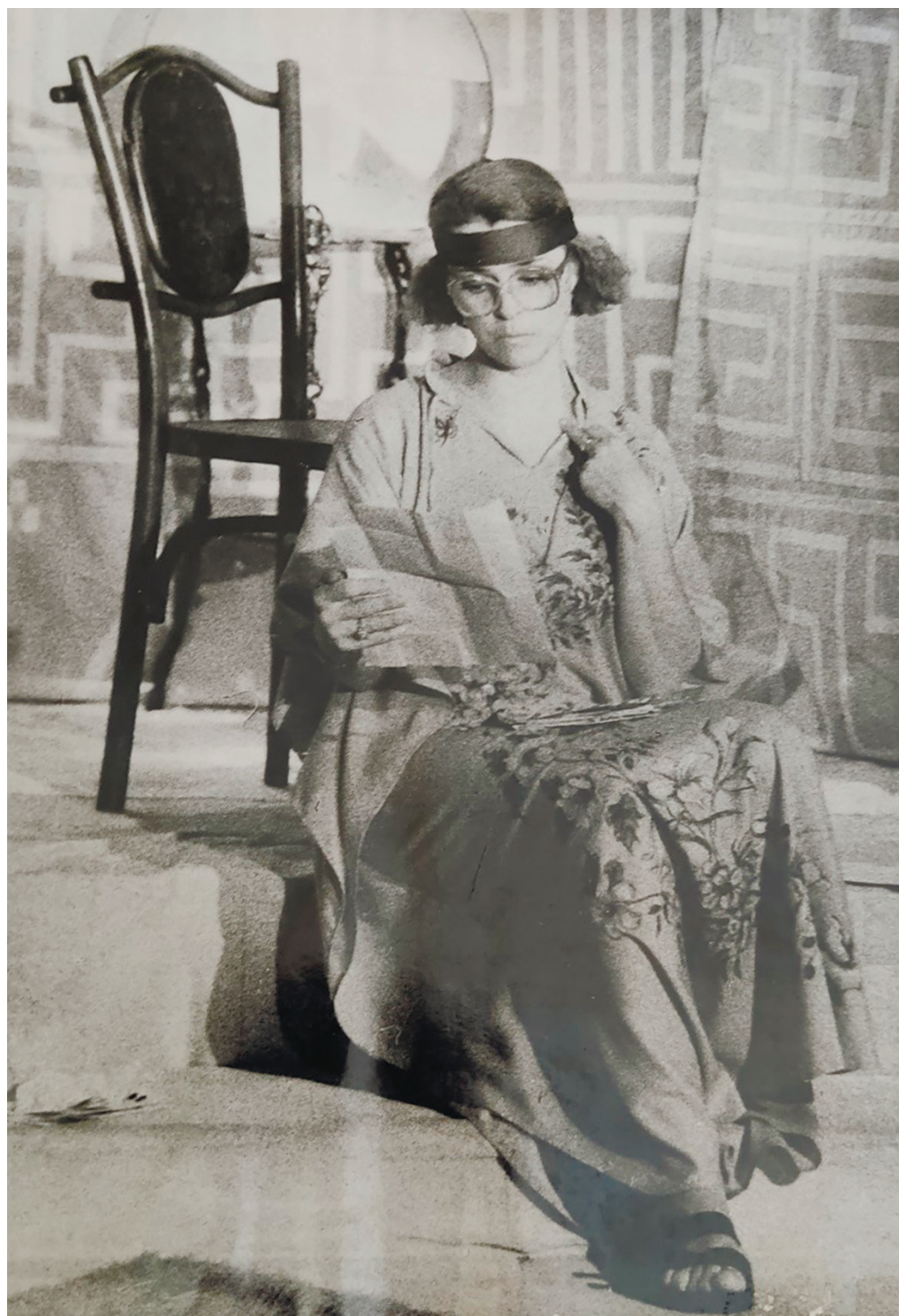
З вистави «Угорська Медея»