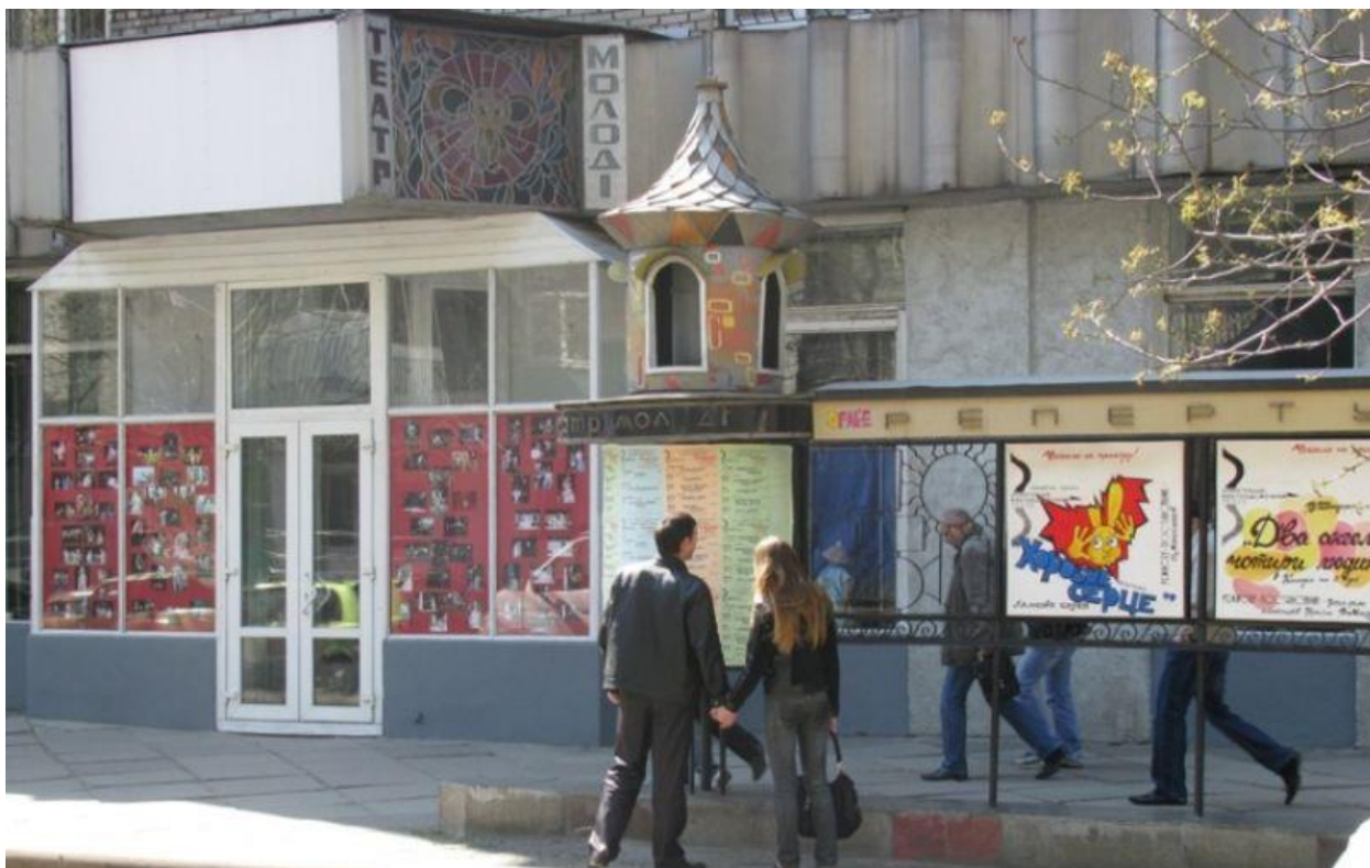
Молодіжний театр на початку 2000х

Молодіжний театр на Московській виступає як наступник двох творчих колективів, продовжуючи їхню історію.