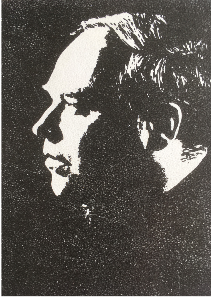
До 100-річчя від дня народження Аркадія Матвійовича Драка